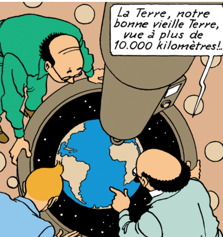
Copyright © Hergé/Moulinart 2007 | Les Aventures de Tintin : On a marché sur la Lune / Planche 4